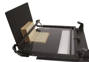
Držák na knihy 100° (V-Shape)