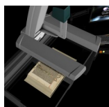
Motorizovaná kolébkka 25cm/25kg