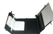
Držák knih 120°