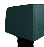
Nová kamera 11 lp/mm na A1